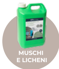
MUSCHI E LICHENI