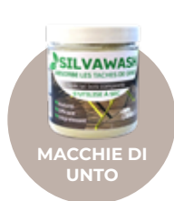
MACCHIE DI UNTO