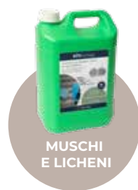
MUSCHI E LICHENI